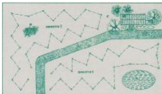
Figura 1 – Exemplo para colheita de amostras num prédio c/ 2 parcelas distintas. Não se deve colher amostras em locais onde estiveram depositados estrumes (a), em locais encharcados (b), ou junto de casa (c).

Em cada parcela percorrer o terreno em ziguezague (Figura 1), colhendo 25 amostras/hectare se utilizar enxada e pá ou 20 – 30 se utilizar uma sonda.