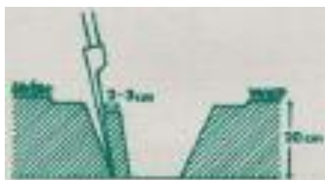
Figura 2 – Exemplo para colheita de cada amostra.

Antes da colheita da amostra deve primeiro limpar-se o local escolhido de ervas, pedras, detritos vegetais, etc. e abrir depois uma cova a uma profundidade de 20 cm. Retirar uma fatia de terra com uma espessura de 2-3 cm e deitar num balde bem lavado (Figura 2).